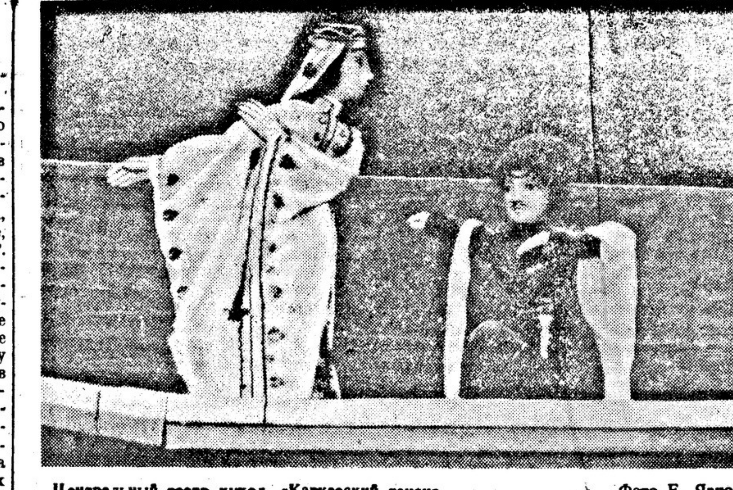
Центральный театр кукол. «Кавказский танец».